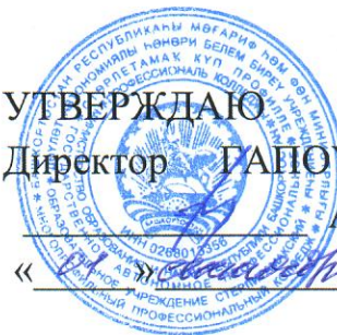
ГРАФИК ПРОМЕЖУТОЧНОЙ АТТЕСТАЦИИ группы ДОУ-13 специальность